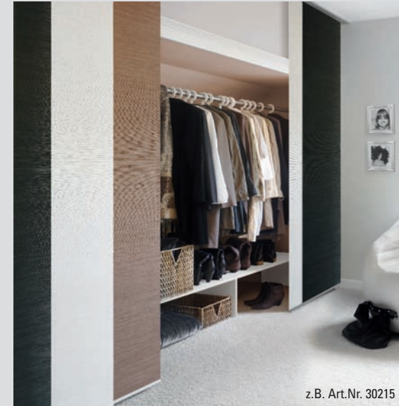
z.B. Art.Nr. 30215

TIPP: Vorstehende Heizkörper oder Mauern lassen sich hervorragend mit den Stoffbahnen verdecken. Ihr Gardinia Team!