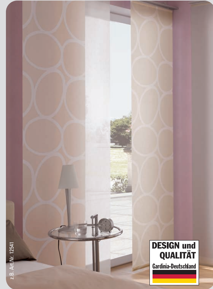
z.B. Art.Nr. 12541

DESIGN und QUALITÄT Gardinia-Deutschland