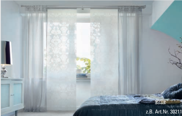
z.B. Art.Nr. 30211

Flächenvorhänge ORNAMENT in Ausbrenneroptyk, kombiniert mit ø 25 mm Stilgarnitur WINDSOR in edelstahl-optik.