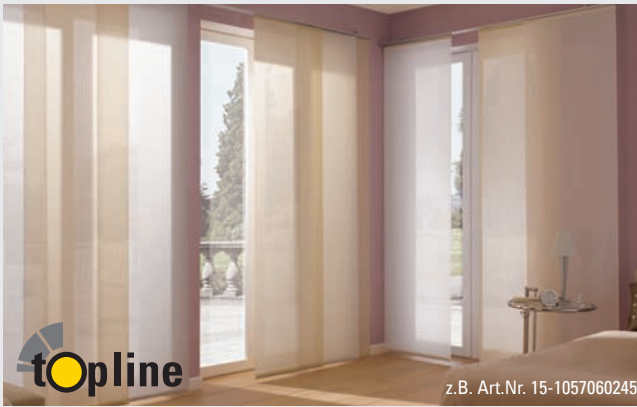
z.B. Art.Nr. 15-1057060245

Flächenvorhänge ORNAMENT in Ausbrenneroptyk, kombiniert mit ø 25 mm Stilgarnitur WINDSOR in edelstahl-optik.