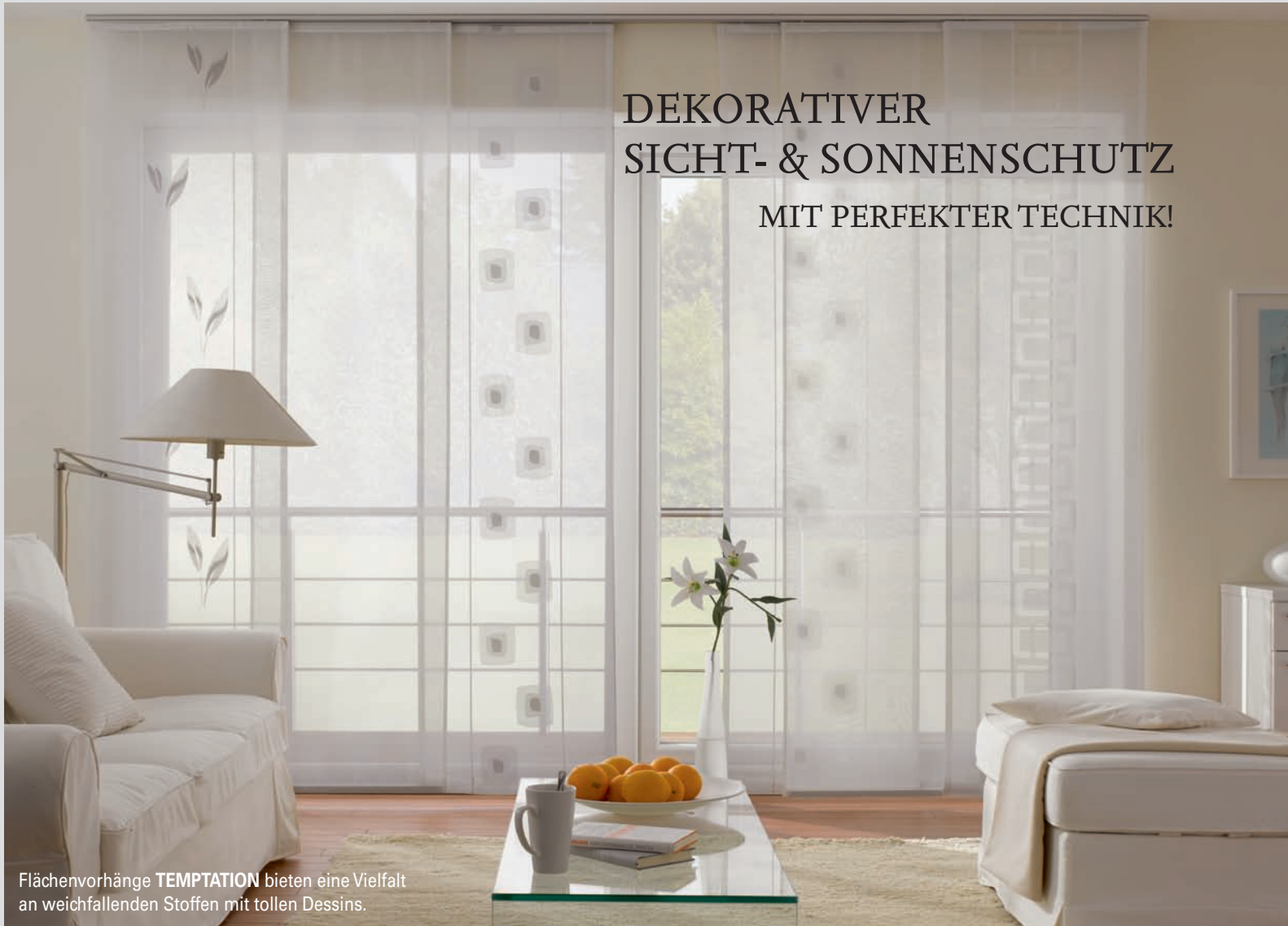
Flächenvorhänge TEMPTATION bieten eine Vielfalt an weichfallenden Stoffen mit tollen Dessins.