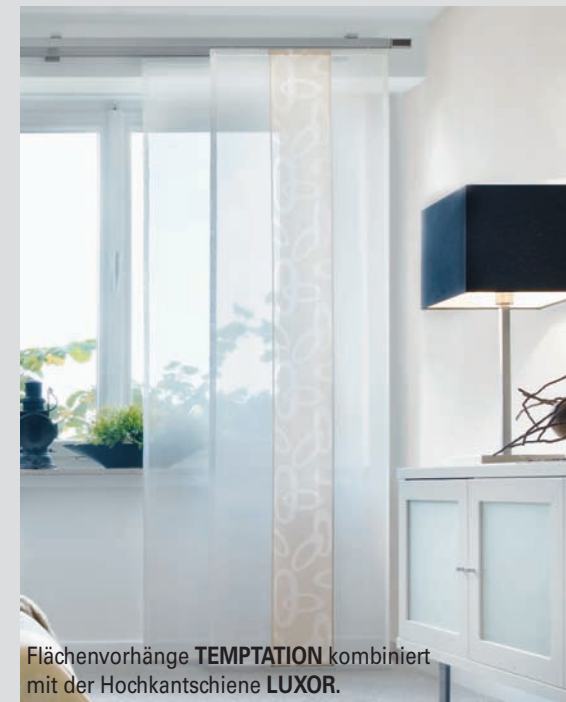
Flächenvorhänge TEMPTATION kombiniert mit der Hochkantschiene LUXOR .