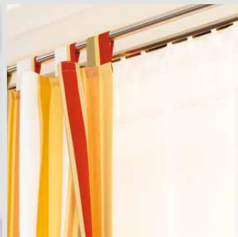
■ Gardinenstangen / Stangen mit Innenlauf