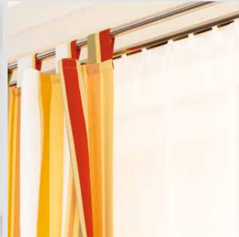
■ Gardinenstangen / Stangen mit Innenlauf