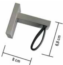
Metall, mit Metallmontageplatte und Kunstlederschlaufe