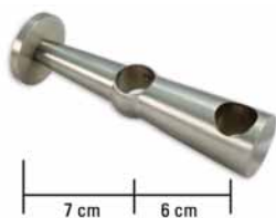
Metall, mit Metallmontageplatte