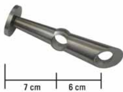
Metall, mit Metallmontageplatte